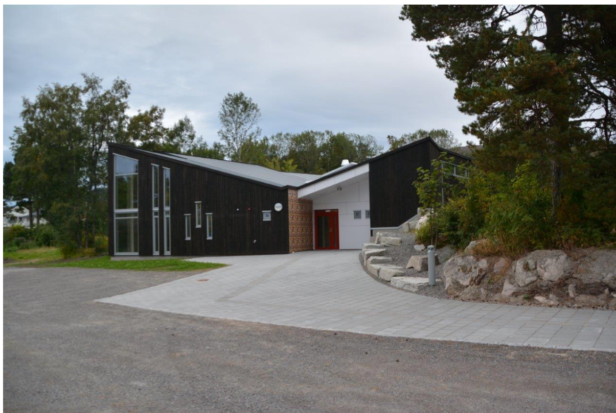
Røbekk kirkesenter – overtatt september 2017.

Vedtatt i møte 14 mars 2018, sak 006/18.