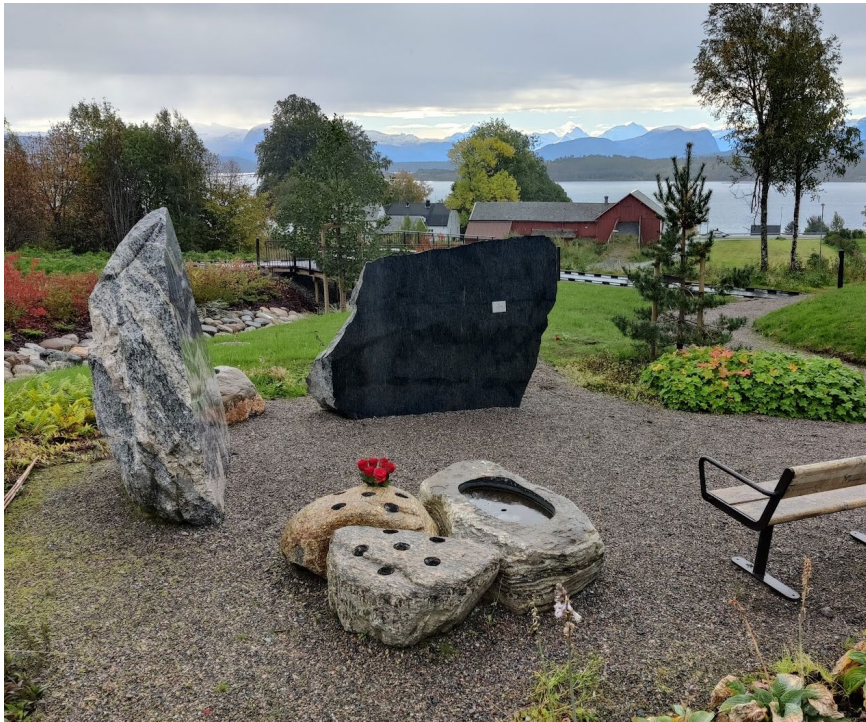
Nye Røbekk gravlund – navnet minnelund

DEN NORSKE KIRKE Molde kirkelige fellesråd